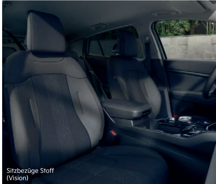
Sitzbezüge Stoff (Vision)

Der Innenraum des Kia Sportage besticht durch stilvolle Gestaltung sowie hochwertige Materialien und wurde genau auf deine Bedürfnisse ausgerichtet. Steig ein und überzeuge dich selbst.