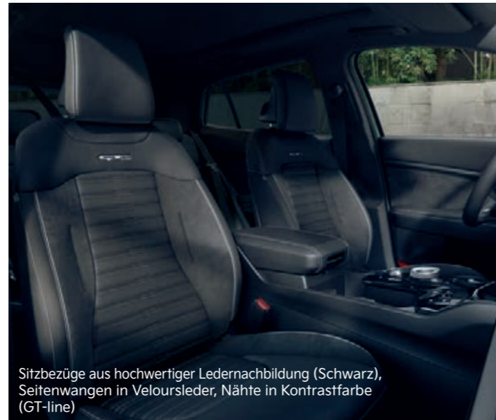
Sitzbezüge aus hochwertiger Ledernachbildung (Schwarz), Seitenwangen in Veloursleder, Nähte in Kontrastfarbe (GT-line)

Kia Sportage 1.6 T-GDI Hybrid AWD AT: Kraftstoffverbrauch (l/100 km) innerorts 4,8; außerorts 6,1; kombiniert 5,6. CO 2 -Emission, kombiniert (g/km): 127; Effizienzklasse: A.