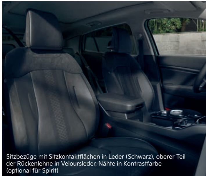
Sitzbezüge mit Sitzkontaktflächen in Leder (Schwarz), oberer Teil der Rückenlehne in Veloursleder, Nähte in Kontrastfarbe (optional für Spirit)