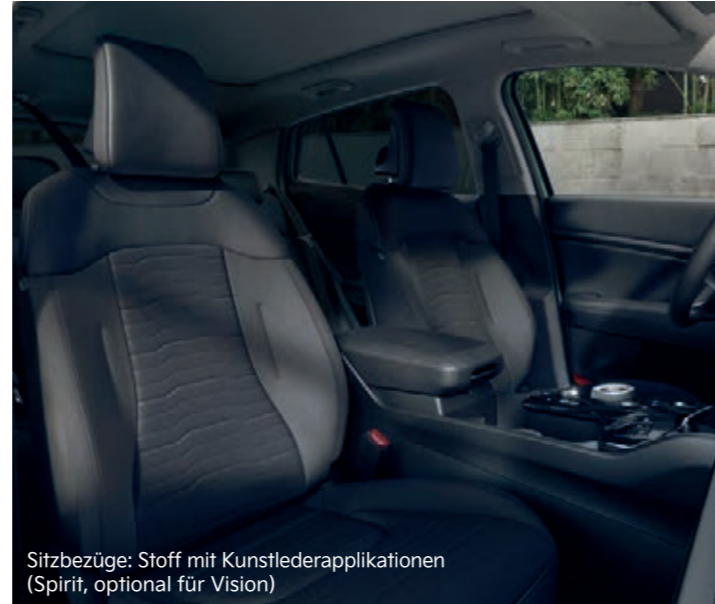
Sitzbezüge: Stoff mit Kunstlederapplikationen (Spirit, optional für Vision)