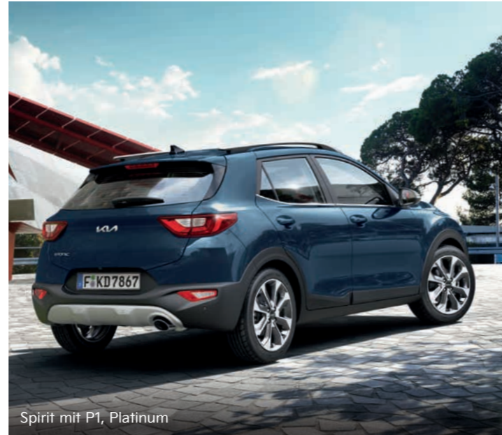
Spirit mit P1, Platinum