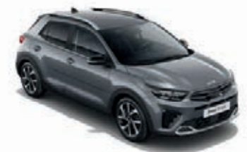
Perennialgrau Met. (PRG)