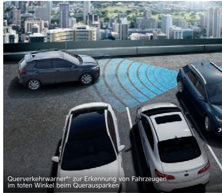
Querverkehrwarner A+ zur Erkennung von Fahrzeugen im toten Winkel beim Querausparken

Der Aktive Spurhalteassistent mit korrigierendem Lenkeingriff (Lane Keeping Assist, LKA) erkennt per Kamera, ob der Kia Stonic unbeabsichtigt seine Fahrspur verlässt. In dem Fall weist dich das System darauf hin und lenkt gleichzeitig geringfügig gegen, um das Fahrzeug in der Spur zu halten.