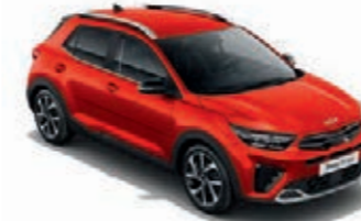
Signalrot Met. (BEG)