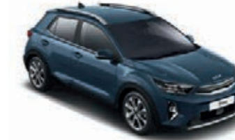
Denimblau Met. (EU3)