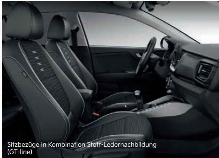
Sitzbezüge in Kombination Stoff-Ledernachbildung (GT-line)