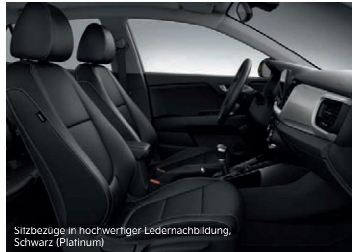
Sitzbezüge in hochwertiger Ledernachbildung, Schwarz (Platinum)

Abbildungen zeigen kostenpflichtige Sonderausstattung.