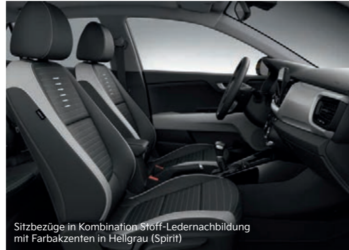
Sitzbezüge in Kombination Stoff-Ledernachbildung mit Farbakzenten in Hellgrau (Spirit)