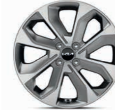
17-Zoll-Leichtmetallfelgen (Spirit und Platinum)