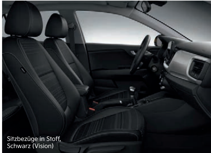
Sitzbezüge in Stoff, Schwarz (Vision)

Hier kannst du dich entspannen: Für den Kia Stonic stehen Sitzbezüge aus Stoff oder Stoff in Kombination mit Ledernachbildung zur Wahl. Die Version Platinum bietet dir Sitze aus hochwertiger Ledernachbildung.