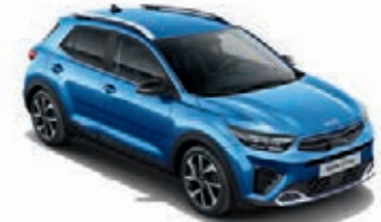
Bathysblau Met. (SPB)