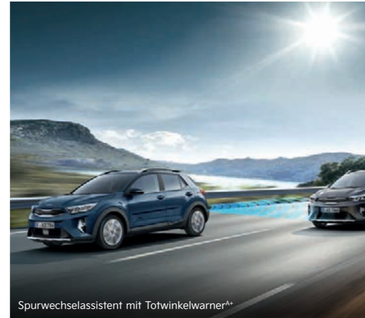
Spurwechselassistent mit Totwinkelwarner A+

Der Müdigkeitwarner (Driver Attention Warning, DAW) erkennt durch die Überwachung von Lenkrad, Blinker und Beschleunigungsmustern, ob deine Konzentration abbaut. Erkennt das System Anzeichen von Müdigkeit, schlägt es dir durch eine akustische Warnung und ein Kaffeetassen-Symbol in der Instrumenteneinheit eine Pause vor.