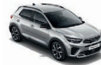
Seidensilber Met. (4SS)