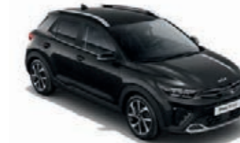
Auroraschwarz Met. (ABP)