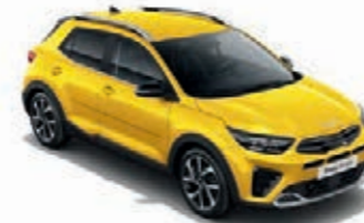
Floridagelb Met. (MYW)